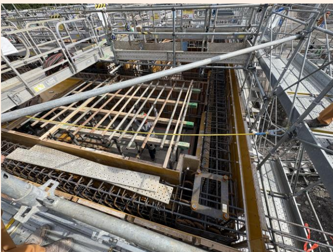
水槽の建設状況（令和8年4月3日撮影）

現在、浸出水処理施設の地下部において、浸出水や上水を溜める水槽の建設工事を進めております。また、施設本体側からの進入路の整備も進めており、併せて擁壁工事も行っています。