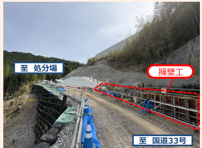
施設本体側の進入路工事の状況（令和8年4月3日撮影）