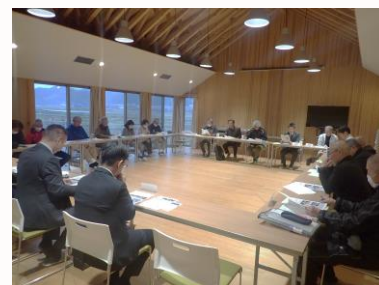
環境保全等連絡協議会の様子